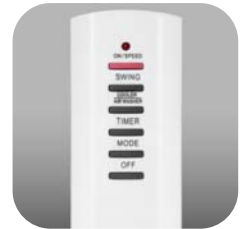
Mando a distancia