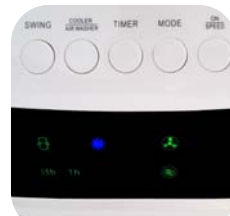
Panel de control