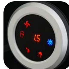
Panel de control