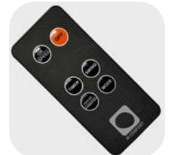
Mando a distancia